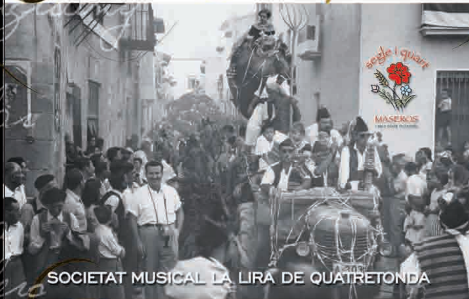
SOCIETAT MUSICAL LA LIRA DE QUATRETONDA